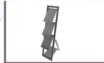
Prospektständer € 95,20/Stk.