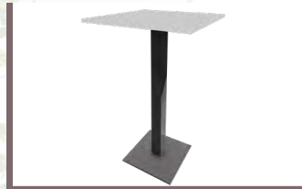
Stehtisch „Lifestyle“ € 86,50/Stk.