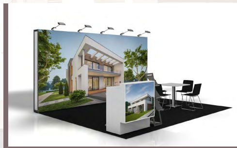
Ansicht Komplettstand VARIO mit Mobiliar