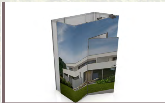
Koje H x B x T 2500 x 2020 x 1030 mm