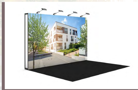
Ansicht Komplettstand VARIO