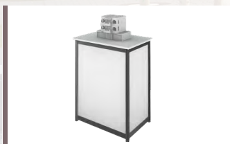
Podeste (Abmessungen: H x B x T)