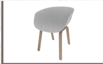
Sessel „Bari“ € 88,90/Stk.