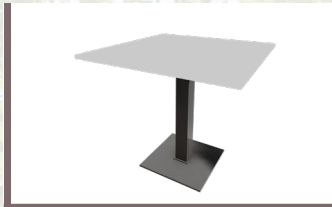
Tisch „Lifestyle“ € 71,20/Stk.