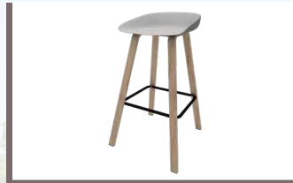
Barhocker „Bari“ € 88,90/Stk.