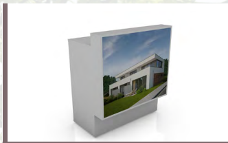
Bar „Fabric“ Bar „Luminar“ hinterleuchtet H x B x T 1120 x 990 x 620 mm